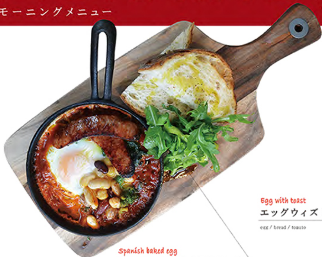
Spanish baked egg スパニッシュベイクドエッグ

tomato sauce / beans / egg / sausage / broccoli / bread