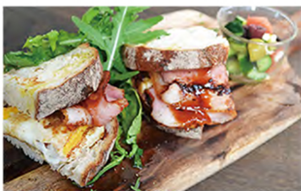
Bacon & egg sandwich ベーコンエッグサンド

bacon / egg / mustard mayonaise / vegetables / BBQ sause / bread olive / tomato