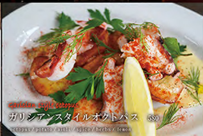
Garlic style octopus ガリシアンスタイルオクトパス 580 octopus / potato / aioli / spice / herbs / lemon