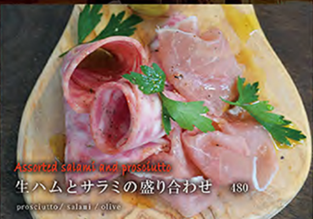
Assorted salami and prosciutto 生ハムとサラミの盛り合わせ 480 prosciutto / salami / olive