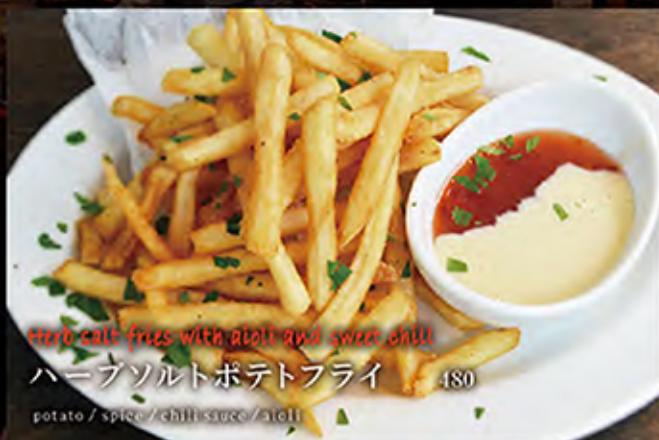
Herb salt fries with aioli and sweet chili ハーブソルトポテトフライ 480 potato / spice / chili sauce / aioli