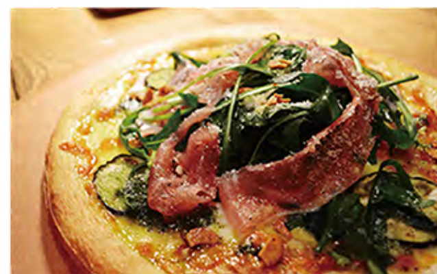
Salad pizza of arugula and prosciutto 生ハムとルッコラのサラダピザ arugula / aubergine / anchovy / garlic / cheese / prosciutto / vegetables 1130