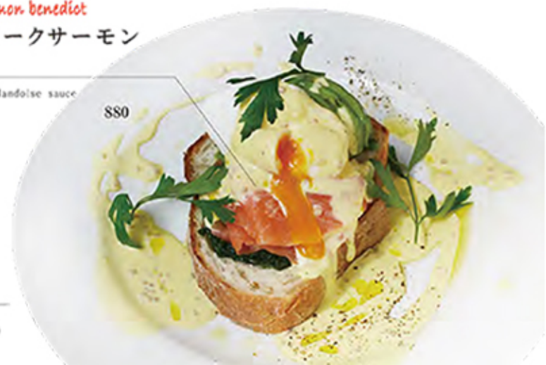
avocado & smoked salmon benedict アボガド&スモークサーモン ベネディクト

avocado / smoked salmon / hollandaise sauce spinach / bread