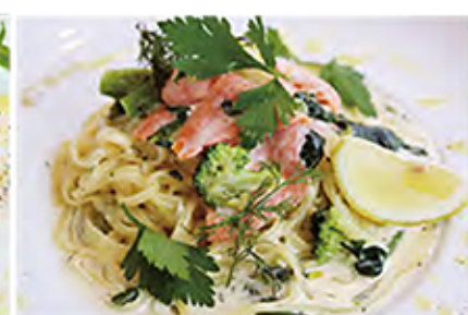
Cream sause pasta スモークサーモンと ほうれん草のクリームPASTA

cream sause / herb / smoked salmon / spinach herb / lemon / extra virginoil