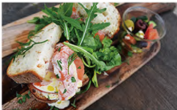
Smoked salmon & avocado sandwich スモークサーモンとアボガドサンド

smoked salmon / avocado / tomato / mustard mayonaise vegetables / bread / olive