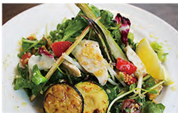
Wealthy Healthy スチームチキンのヘルシーサラダ steatchicken / vegetables / lemon / olive / extra virginoil