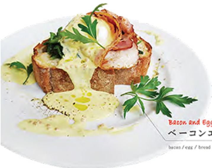
Bacon and Egg benedict ベーコンエッグベネディクト

bacon / egg / bread / hollandaise sauce / spinach