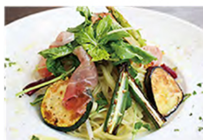
Peperoncino グリル野菜と生ハムの ペペロンチーノ

prosciutto / garlic / chili pepper / vegetables olive / extra virginoil