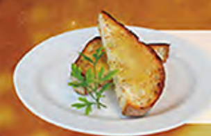
Rye bread 石窯焼きライ麦パン 150