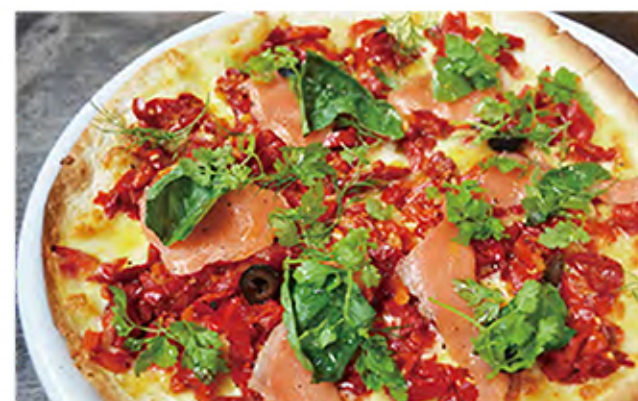
Healthy pizza paprika and smoked salmon スモークサーモンとパプリカのヘルシーピザ smoked salmon / paprika / cheese / walnuts / herbs / olive 980