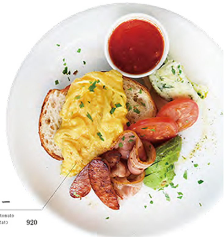
Big brekky ビックブレッキー

bread / egg / sausage / bacon / tomato avocado / tomato sauce / hashpotato