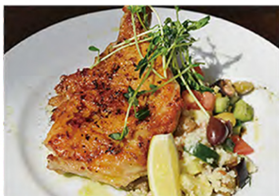
Harissa chicken 骨付きチキンのスパイシーロースト [パン付] chicken / vegetables / lemon / mash potato / spice / bread 1230