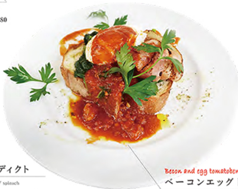
Bacon and egg tomato benedict ベーコンエッグトマトベネディクト

bacon / egg / bread / tomato sauce / spinach