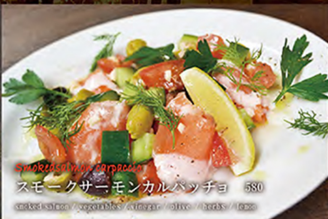
Smoked salmon carpaccio スモークサーモンカルパッチョ 580 smoked salmon / vegetables / vinegar / olive / herbs / lemon