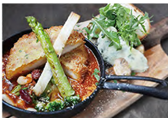
Chicken parmesan チキンパルメザン [パン付] chicken / tomato sauce / cheese / vegetables / mash potato / beans / bread 1230