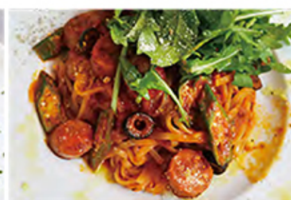
Tomato sause pasta ハーブソーセージと オクラのトマトPASTA

tomato sause / sausage / okra / cheese / olive vegetables / extra virginoil