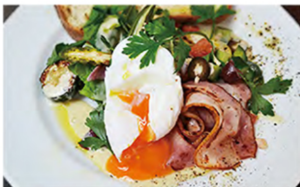
Grilled veggie with bacon and poached egg グリル野菜とベーコンエッグサラダ [パン付] egg / bacon / vegetables / aioli / olive / extra virginoil / bread