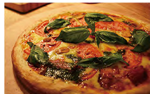
Tomato & Basil margherita pizza トマト&バジルのマルゲリータピザ tomato / cheese / basil / garlic / salami 1130