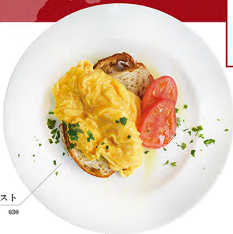
Egg with toast エッグウィズトースト