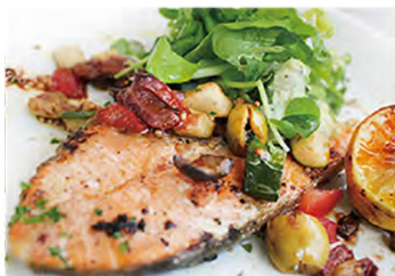
Grilled Salmon with Balsamic Marinade グリルドサーモンとバルサミコマリネード [パン付] salmon / olive / balsamic vinegar / lemon / mash potato / vegetables / bread 1380