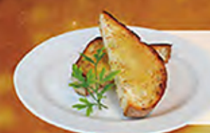
Rye bread 石窯焼きライ麦パン 150