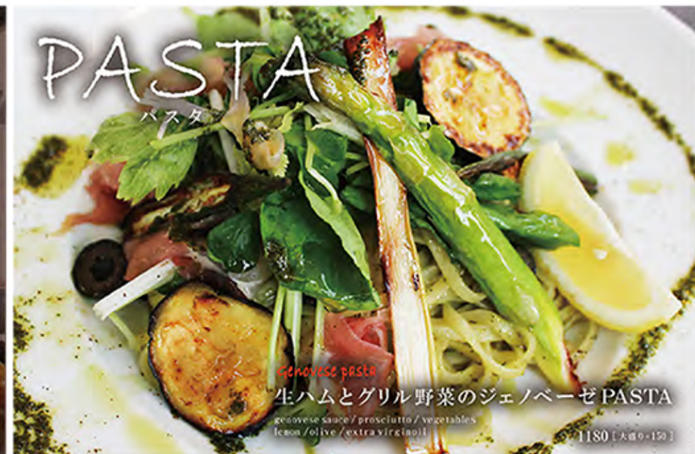
Genovese pasta 生ハムとグリル野菜のジェノベーゼ PASTA genovese sauce / prosciutto / vegetables lemon / olive / extra virgin oil