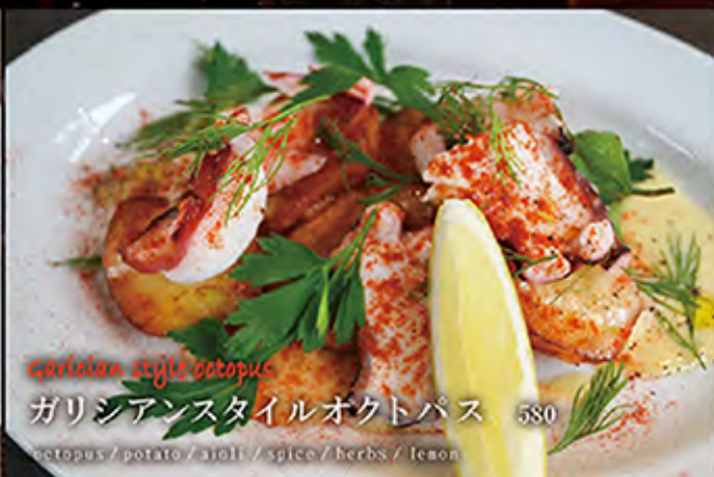
Galician style octopus ガリシアンスタイルオクトパス 580 octopus / potato / aioli / spice / herbs / lemon